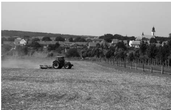
Řepka je v zemi, nový hospodářský rok začíná. Doufejme, že bude úrodný!

Velkopavlovičtí zemědělci vyseli koncem srpna na poli v trati Nadzahrady ozimou řepku a tím prakticky zahájili nový hospodářský rok. Podle staletých selských zkušeností je ideální, když se za secím strojem práší, osivo se pak dostane dobře do půdy. Letos tomu tak opravdu bylo – tropické počasí napomohlo staříčkou pranostikou naplnit beze zbytku, úroda snad tedy bude bohatá. Avšak práce zemědělců byla v takových podmínkách skutečně velmi fyzicky vyčerpávající.