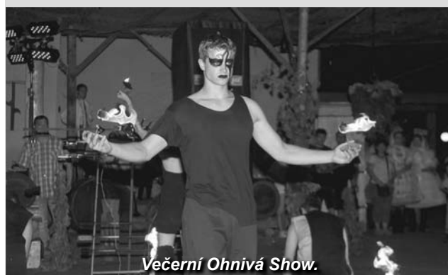
Večerní Ohňová Show.