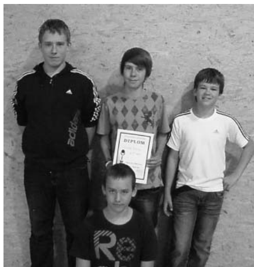
Mladí úspěšní stolní tenisté z Velkých Pavlovic postoupili do krajského kola soutěže.