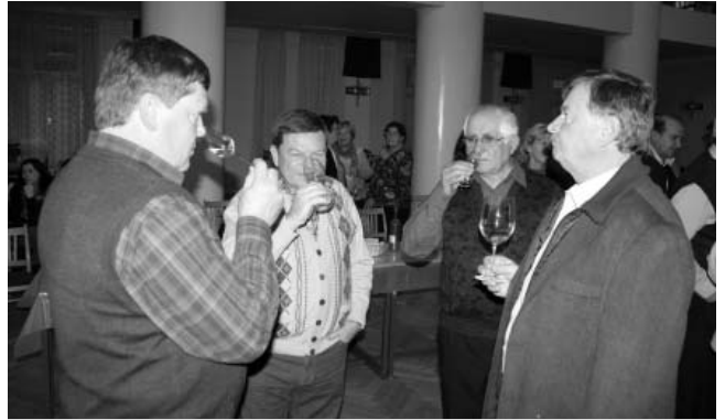
Doufejme, že i mladé víno roku 2011 zachutná tak dobře jako to loňské.

Teď však přichází náročná doba pro vinaře ve sklepích při