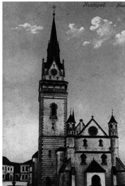
Stará pohlednice „zmizelého“ kostela sv. Václava v Hustopečích.