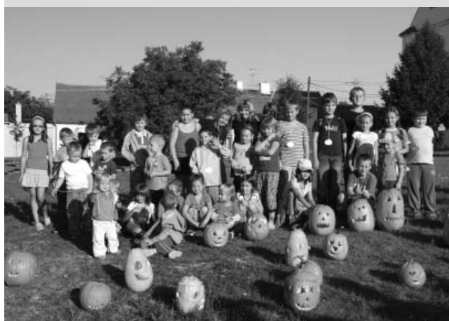
... a nakonec samozřejmě – nezbytné společné foto malých umělců v parčíku za sýpkou.