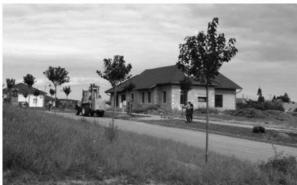
Nové stromky jsou nejen krásnou ozdobou města, ale také jejich plicemi.