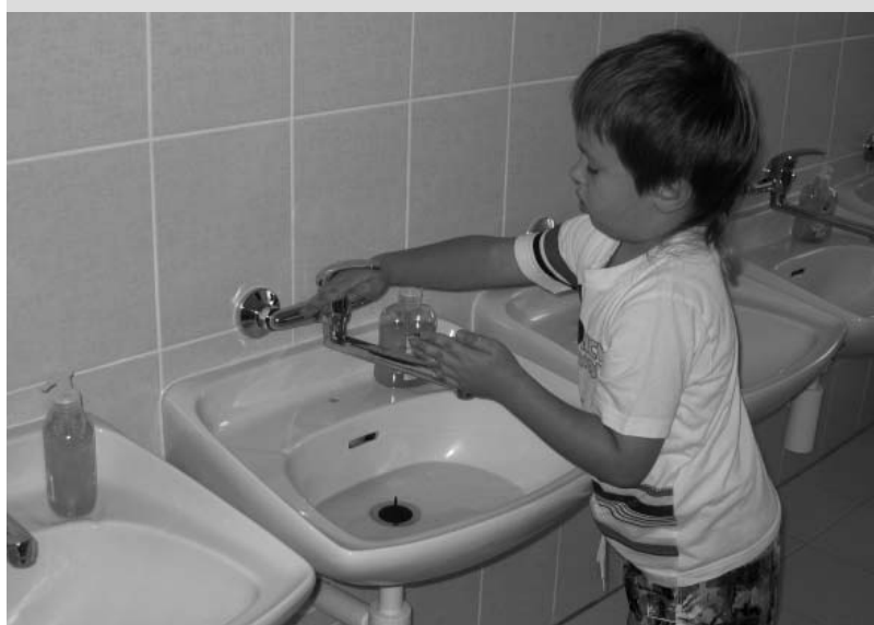
Nové umývárky již slouží dětem.