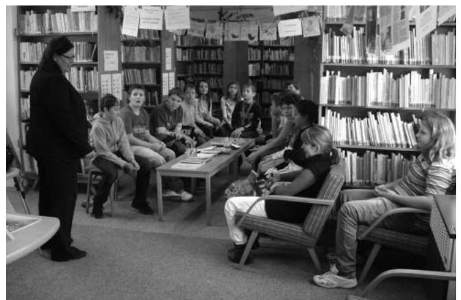
Nejmladším studentům velkopavlovického gymnázia se v knihovně zalíbilo. Mnozí se poté stali novoapečenými čtenáři.