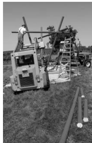
Pod Slunečnou se začíná s montáží konstrukce nového odpočívacího místa.