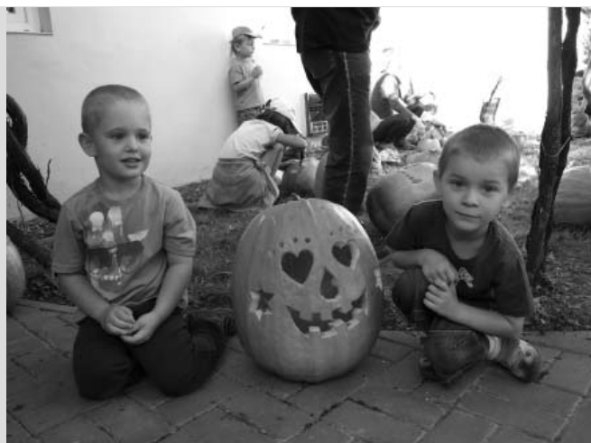
... po té se na dvorku knihovny pózovalo...