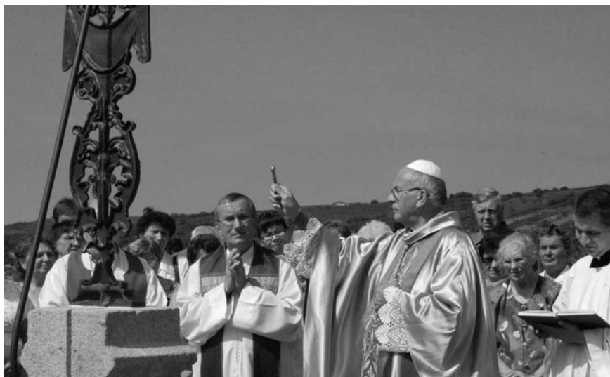
Modrohorskému polnímu kříži na Dvořankách se dostalo slavnostního žehnání.