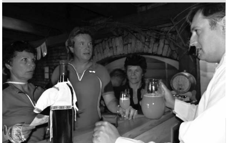
A kdo se občas cítil na pokraji svých sil, načerpal rychlou energii a dokonce i přírodní antibiotikum, v podobě bublajícího burčáku!