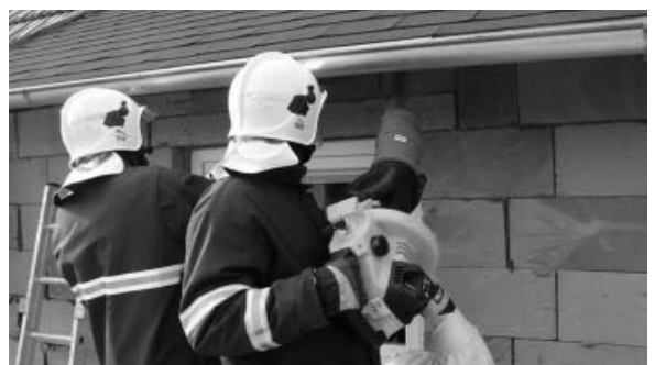
Včelkám se až příliš zalíbilo pod okapem rodinného domku. Krom ohně, vody, vyprošťování z aut či záchrany kořat z vršků vysokých stromů, se pro tentokrát museli hasiči pustit do boje s bodavým hmyzem.