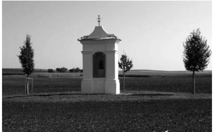
Sněhobílá kaplička sv. Antonína Paduánského s dřevěnou plastikou svého světce, patrona za nalezení ztracených věcí; manželství; žen a dětí, chudých, cestujících; za šťastný porod, proti neplodnosti; františkánů a mnoha dalších.