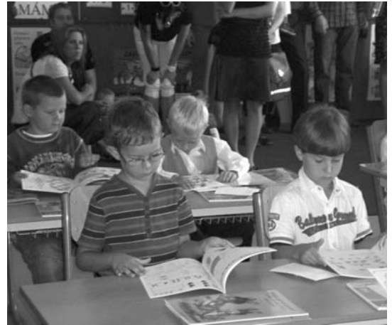
Prvníáčci usedli poprvé do školních lavic. Přejeme jim, aby všechny následující dny byly tak příjemné a plně nadšené, jako jejich velká školní premiéra!