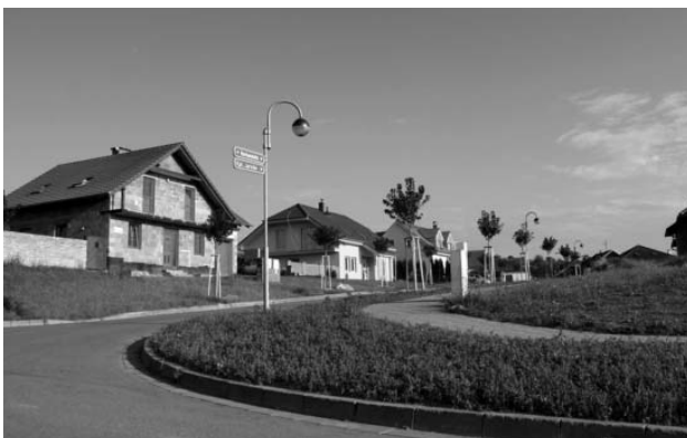
Ulici Horňanského v nové čtvrti Padělky ozdobí zjara krásné květy sakur.