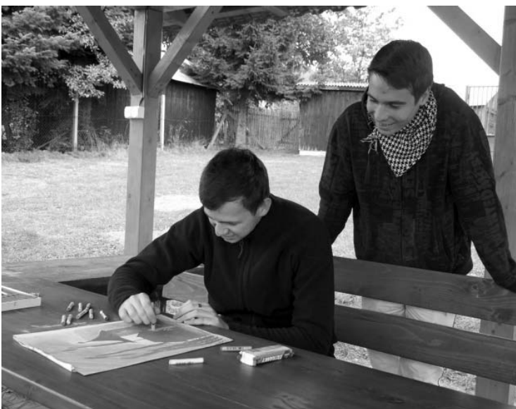
Slovenská Bratislava – inspirativní krajina pro výtvarnou dílnu.

Účastníci výtvarné dílny Bratislava 2011