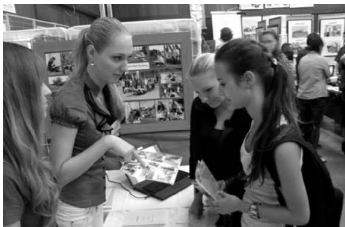
Studenti velkopavlovického gymnázia propagují svou školu na veletrhu v Hodoníně.

Naši studenti si v praxi během dvou dnů vyzkoušeli své komunikační schopnosti a přispěli svým vlídným a kultivovaným vystupováním k reprezentaci naší školy a již