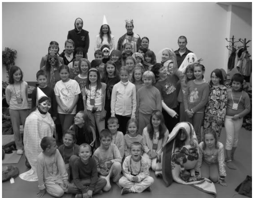
Pohádkoví účastníci letošní podzimní víkendovky v Těšanech.