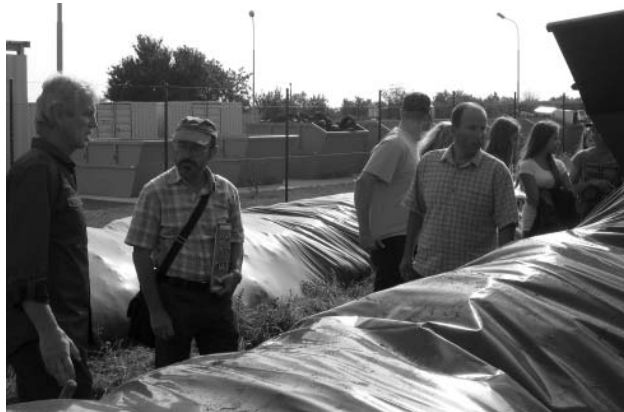
Hantály nejen odpad zpracovávají, ale také se snaží naučit širokou veřejnost odpad správně třídít.

Firma Hantály a.s. připravila na čtvrtek 6. října 2011 Den otevřených dveří. Zájemci z řad veřejnosti, ale také žáci a studenti místních škol si v provozu prohlédli drtící a třídící linku na stavební suť a ukázkou zpracování biologického odpadu, který vzniká při údržbě veřejné i soukromé zeleně, na kompost. Především se všichni návštěvníci poučili o důležitosti třídění odpadu a prohloubili své poznatky o tom, jak odpad správně třídít.