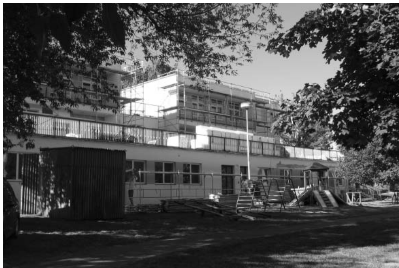
Mateřinka a přilehlá školní zahrada v období rekonstrukce.