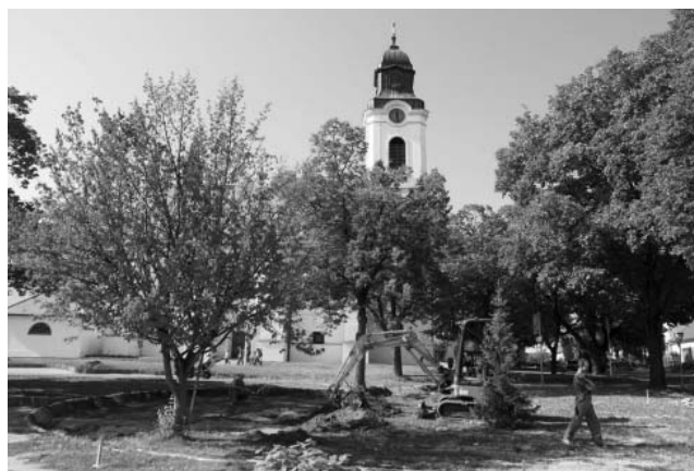
Výsadba nových stromů a úprava parku u kostela