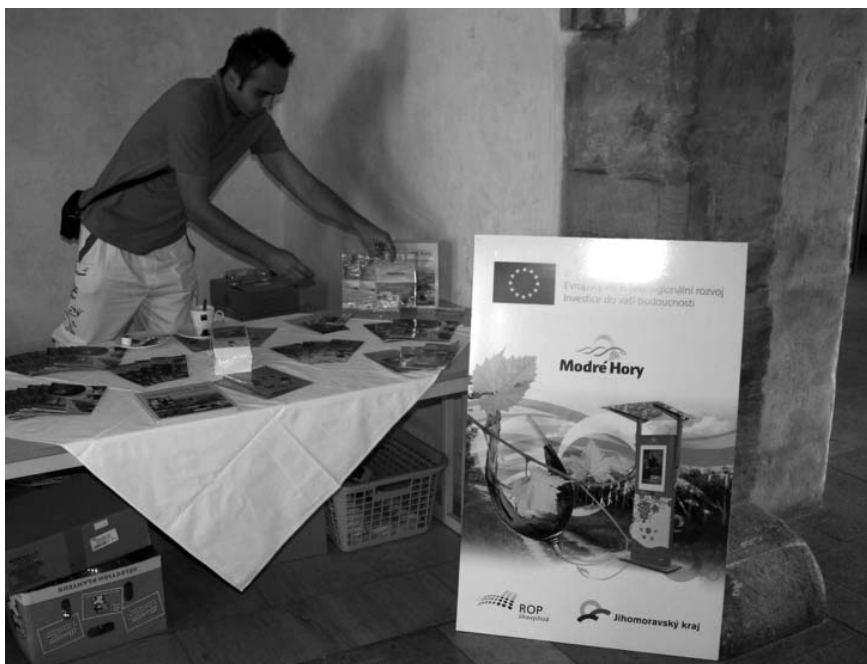
Originální víno a burčák z Modrých Hor byly letos zcela poprvé k mání i v Praze, v rámci Novoměstského vinobraní.