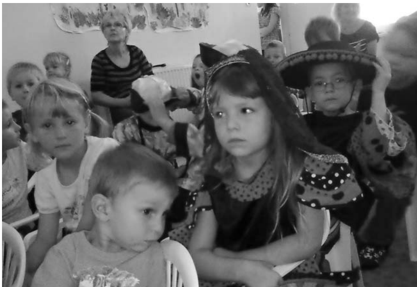
Na Safari vládla pohodička a veselí!

V úterý, dne 4. října 2011, přijelo do mateřinky pravé nefalšované „SAFARI“. Děti měly možnost „cestovat“ v oděvech typických pro nejrozmanitější kouty naší planety Země a moc se jim to líbilo. Že zde vládla pohoda a dobrá nálada je zřejmé i z přiložené fotografie.