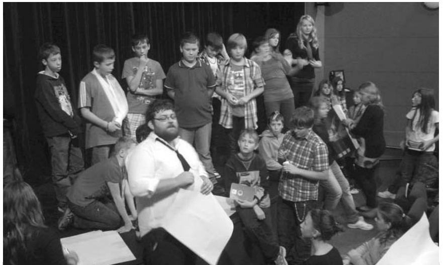
Studenti primy a sekundy s herci brněnského divadla Polárka na semináři na téma „Rozbor hry Staré řecké báje a pověsti“.