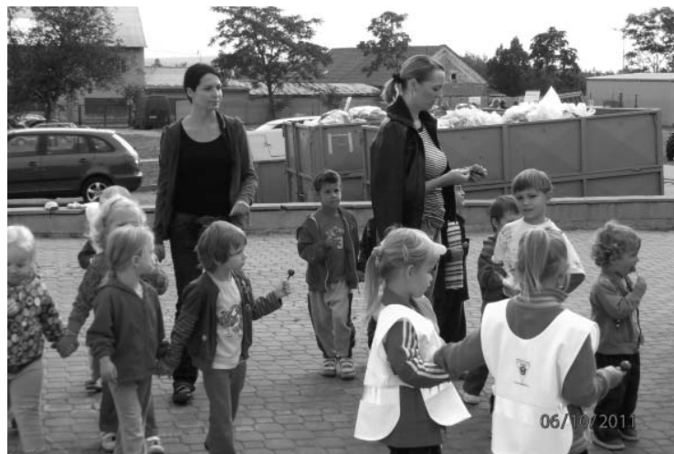
Jak pomoci přírodě kolem nás? Třeba právě tím, že papírek od lízátka nezahlodím na zem, ale dám jej do odpadkového koše. I takové zdánlivě maličkosti ohledně nakládání s odpadem se děti na exkurzi na Hantálech přiučily.