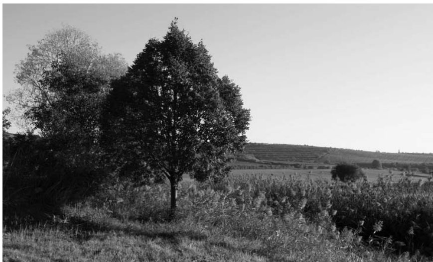
Již dříve dával všude přítomný rákos tušit, že se zde vodě více než daří...