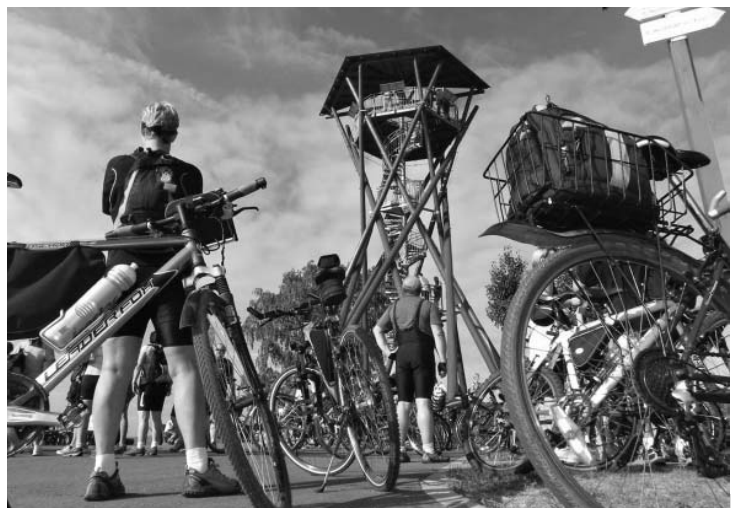
Putující za burčákem po Modrých Horách startovali pod Slunečnou ve Velkých Pavlovicích. Což bylo místo ideálně zvolené – z ochozu rozhledny si prohlédli jako na dlaní celou krajinu Modrých Hor a mohli si tak zvolit trasu a strategii výletu dle svého vkusu i fyzických možností.