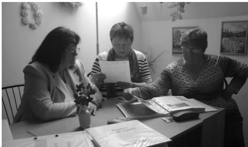
Členky Dámského klubu z Velkých Pavlovic předávají dar Domovu sv. Agáty v Břeclavi.

Dům nabízí 14 bytových jednotek, k dispozici je prádelna se sušárnou, děti si mohou hrát na velké zahra-