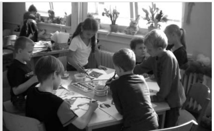
Tvoření a hraní – činnosti s družinkou neodmyslitelně spojené.