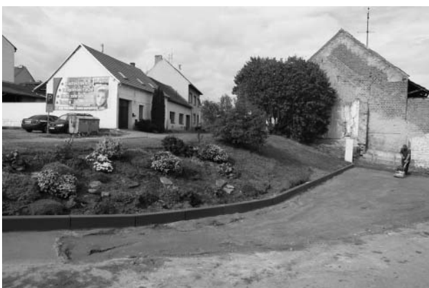
Nové odstavené parkoviště na ul. Hlavní.

Pracovníci služeb města vybudovali pod odbočkou z Hlavní ulice odstavné parkoviště, na kterém může stát až pět vozidel. Nové parkoviště svým dílem přispěje k řešení trvalého nedostatku parkovacích míst ve městě.