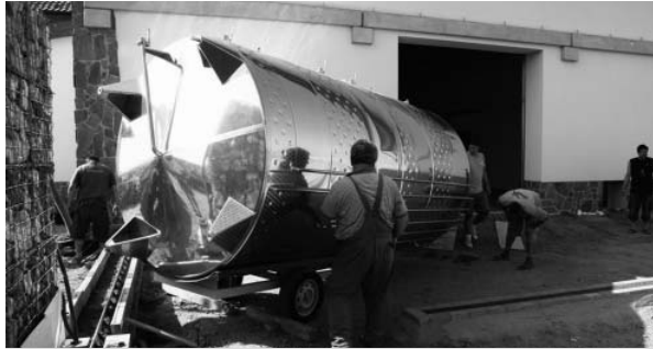
Do nové výrobní haly Rodinného vinařství Poliak – ŠSV V. Pavlovce, a. s. byly nainstalovány nezbytné nerezové tanky.