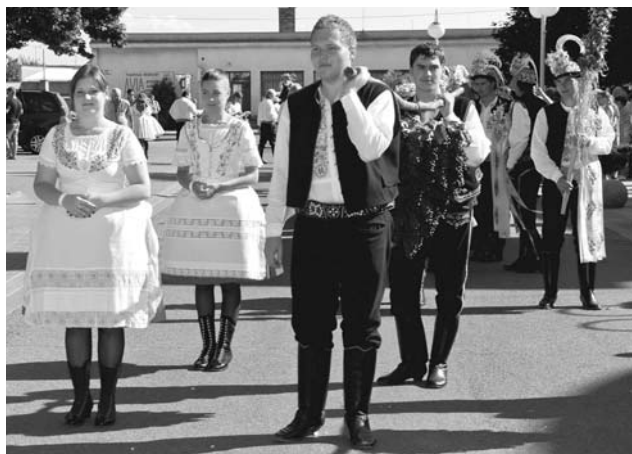
Slavnostní průvod zastavil na náměstí před radnicí.