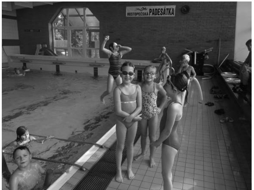
Plavání? To „plavat“ určitě nenecháme!