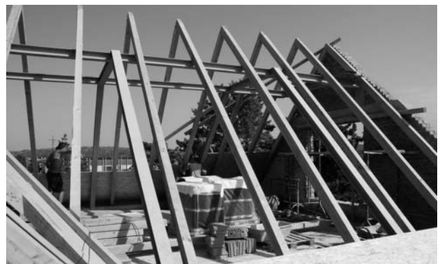
Nové dřevem vonící krovy zámečku čekají na položení střešní krytiny.

Dodavatelská firma dokončila o prvním zářijovém týdnu montáž krovů na střeše Zámečku a začala osazovat izolační prvky střešního pláště. Po několika týdnech náročných prací, kdy byla sejmuta stará střecha a vyměněny stropy, se tak zkonkretizoval nový vzhled budovy.