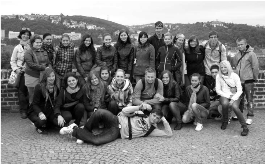
V Praze bylo maturantům vesele a blaze! Alespoň na chvíli zapomněli na blízkou se náročnou zkoušku dospělosti.

Ani úterý nebylo na zážitky skoupé. Zájezdovým autobusem jsme se přepravili do Lidic, města vypáleného za druhé světové války. Tam jsme v Památníku absolvovali krátký program, který nás seznámil s lidickou tragédií. Procházka po bývalých Lidicích v nás zanechala nerasmazatelné stopy, protože jsme mohli na vlastní oči vidět místa, kde před 60 lety zemřelo více než 170 lidí a odkud museli odejít i všechny ženy a děti, aby nacistický režim pomstil atentát na Reinharda Heidricha. Nedílnou součástí literárně-historické exkurze do Prahy bývá i návštěva divadelních představení. Letos padla volba na dvě vynikající inscenace. První z nich - hra Na útěku - se konala v divadle Ungelt - malém divádě poblíž Staroměstského náměstí. V této inscenaci excelují dvě významné české herečky - Zlata Adamovská a Jana Štěpánková. Výkony obou zmiňova-