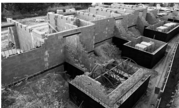
Vinařská ulička Starohorka roste přímo před očima.

Developerský projekt – Vinařská ulička Starohorka firmy Mons Antiquus, s.r.o. začala o prázdninových měsících roku 2011 nabývat konkrétní podobu. Po výkopových pracích a přesunutí značného množství zeminy se začalo s výstavbou objektů - jak vinných sklepů, tak i „presúzů“.