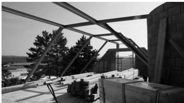
Nosná konstrukce pro krovy připravena, tesaři se mohou dát do práce.

Subdodavatelská tesařská firma začala koncem měsíce srpna 2011 s montáží dřevěného krovu na střeše Zámečku. Současně s tesaři pracovali na stavbě také zedníci, tesaři, elektrikáři, instalatéři a další řemeslníci.