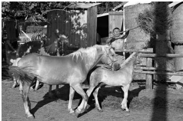
Milá hříbátka brzy dospějí, budou z nich nádherní koně.