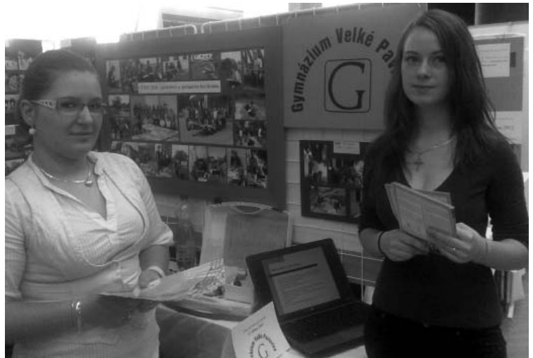
Studentky velkopavlovického gymnázia na veletrhu středoškolského vzdělávání v Břeclavi.

Potěšující pro nás byl i fakt, že zájem měli sourozenci nebo kamarádi našich bývalých absolventů, kteří prostředí školy dobře znají. Naši studenti si tak během dvou dnů v praxi vyzkoušeli komunikační dovednosti, schopnost diskutovat, argumentovat a odpovídat na případné dotazy. Svým pěkným vystupováním a aktivním přístupem přispěli nejen k dobré reprezentaci své školy, ale i města Velkých Pavlovic.