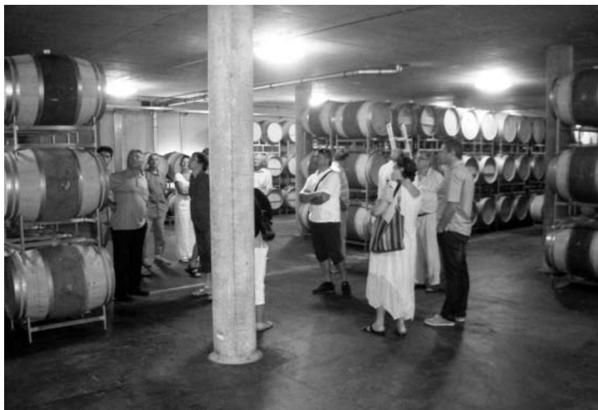
Exkurze u rakouských sousedů nás seznámila s tamnějšími výrobními technologiemi u nás tolik oblíbeného vinného moku.