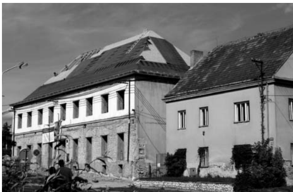
Zámeček těstě před položením střešní krytiny.

Subdodavatelská firma pracovala během celého měsíce září na rekonstrukci střechy Zámečku. A to dokonce i o víkendech, kdy se snažila využít příznivého počasí k montáži krovu a všech složek střešního pláště. Na ten pak přišly položit tašky bobrovky.