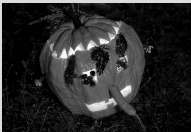
V tichu noci tajemně rozsvěcování...