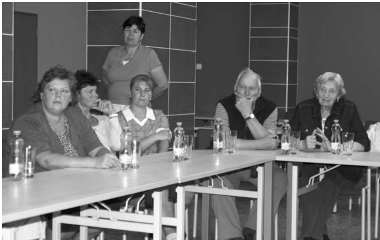
Účastníci prvního diskusního fóra s tematikou sociálních služeb.