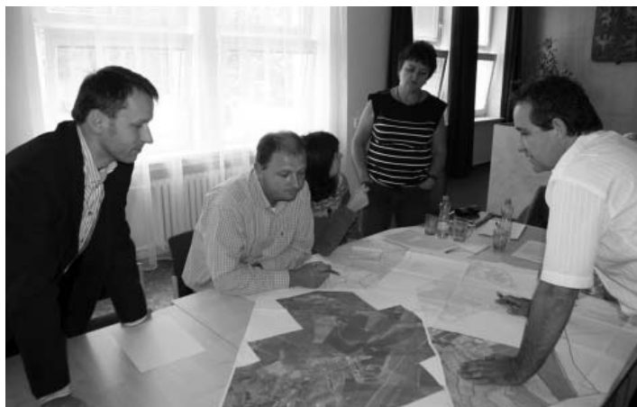
Živá diskuse nad katastrálními mapami Velkých Pavlovic.