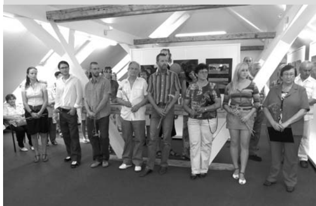
Vystavovatelé z Velkých Pavlovic – malíři a fotografové.

Vernisáží dne 19. srpna 2011, byla v rámci „Senického kulturního leta 2011“, zahájena výstava 9 velkopavlovičských malířů a fotografů v Galerii Základní umělecké školy v partnerském městě Senica.