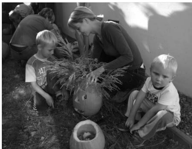
Nejdříve se pilně pracovalo...