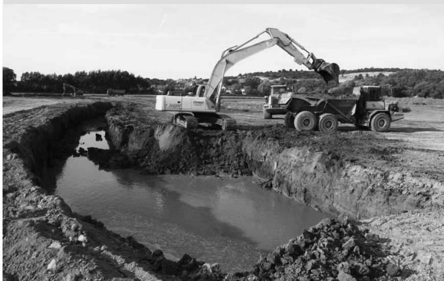
Jakmile se odkrylo prvních pár desítek centimetrů zeminy, začala rychle nastupovat spodní voda. Přirozená lokalita vhodná pro rybník se nezapře.