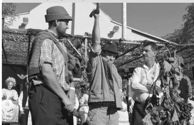
Divadelní scénka Zarážení hory.