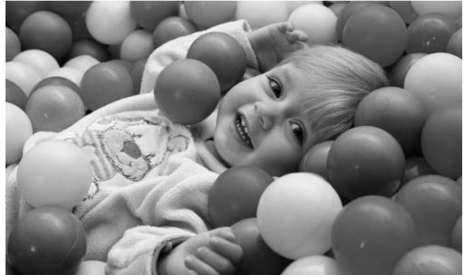
Děti září v Budulínku spokojeností a štěstím, co více si přát...

Budeme rádi, když přijedou i maminky z okolí. Před pár lety k nám dojžděly například z Hustopečí," láká Velko-