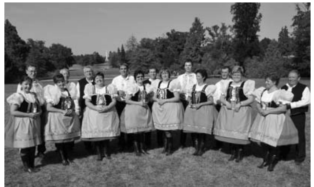
Velkopavlovický mužácký Presúzní sbor se zpěvačkami z Moravské Nové Vsi.

Nedaleký Lednicko-valtický areál pořádal ve dnech 3. a 4. září 2011 Open Air festival ICE WINE DU MONDE, kam byl jako jeden z příjemných folklorních bodů bohatého programu přizván i velkopavlovický mužácký pěvecký Presúzní sbor. Mužáci zde vystoupili spolu s ženským pěveckým sborem z Moravské Nové Vsi. Svým pěveckým uměním tak zpestřili vedle Velkopavlovického vinobraní další vinařskou akci konanou v regionu jižní Moravy.