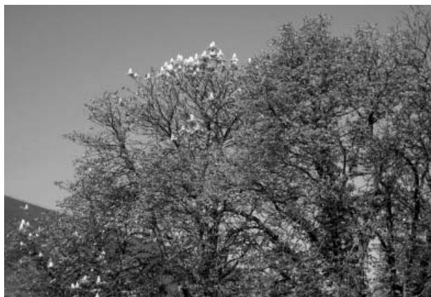
Říjen – neříjen, kaštiny kvetou jako na jaře ☺!

Neobvykle teplé září s průměrnou teplotou 17,9 °C dokonale popletlo kaštiny u sokolovny. Ty sice shazují listí i kaštiny, jak se na začátek října sluší a patří, ale zároveň se také zazelenaly svěží zelení mladého listoví a do dálky svítí bílé svíce květů.