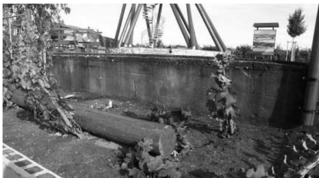
Pravděpodobně tak si představují vandalové „pěkné posezení“ mezi vinicemi.

Ani hodovní dny plné veselí a dobré nálady neodradily vandaly od svého jen těžce pochopitelného řádění. Pro tentokrát si vyhlídli jako svůj cíl prostranství pod rozhlednou Slunečná na cestě mezi Velkými Pavlovicemi a Bořeticemi. Pravděpodobně jim bylo trnem v oku odpočinkové místo s lavičkami. Kdopak ví, kolik silných chlapců muselo těžkou kládu, která slouží k posezení návštěvníků, zvednout a následně i poničit mladé keře vinice, kam kládu odhodili. Spíše než škoda, která nám byla způsobena, nás mrzí poznání, jací lidé mezi námi žijí. Proč nejsou schopni spíše pomáhat než ničit?