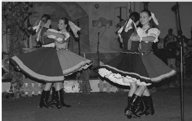
Vystoupení folklórního souboru Břeclavan.

Co více si přát? Snad jen – za rok nad skleničkou burčáku na shledanou!