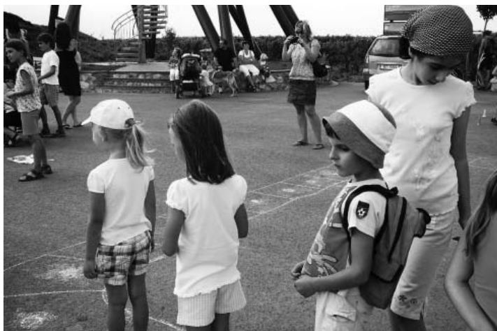
Všechno jednou končí, i předlouhé letní prázdniny. Avšak žádné smutnění, i loučení může být krásné a veselé!