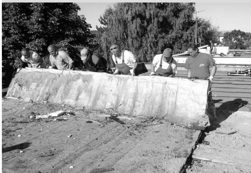
Demolice staré střechy.